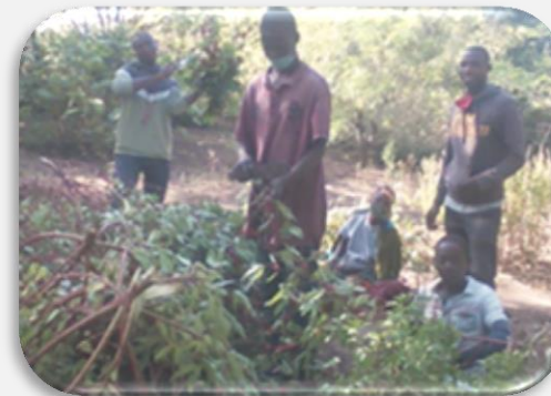
Bild: Artemisia annua anamed und Hibiscus sabdariffa Ernte, in unserem Garten in Mossuril.

Der Präsident von Madagaskar hat sich sehr positiv über Artemisa (Heilpflanze) geäußert. Leute in Mosambik möchten nun auch gerne Artemisia Tee haben, jedoch ist die Nachfrage größer als unser Angebot. Wir haben nicht genug Artemisia Tee und die Pflanzen in den Gärten sind noch zu klein, um geerntet werden zu können. Wenn Du mehr Infos über Artemisia annua anamed und Corona haben möchtest, siehe Steckbrief A3 im Anhang.