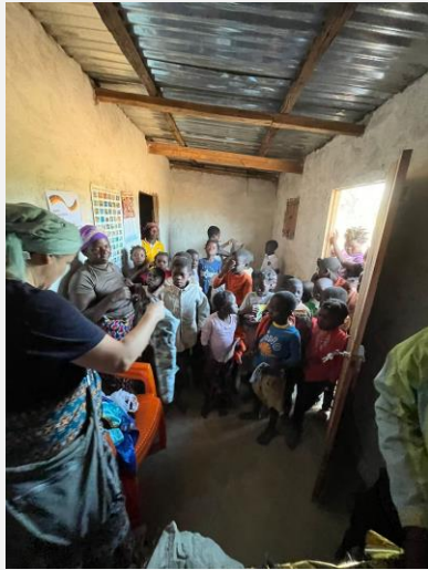
Die Waisenkinder singen sooo schön!