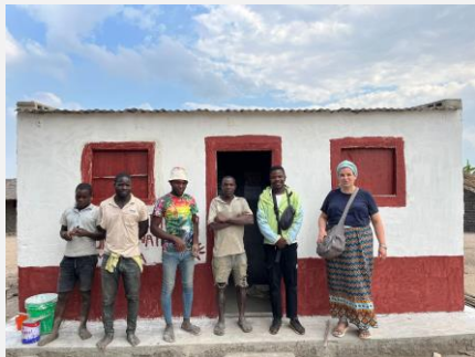
Wiederaufbau der Posten ist immer noch aktuell.