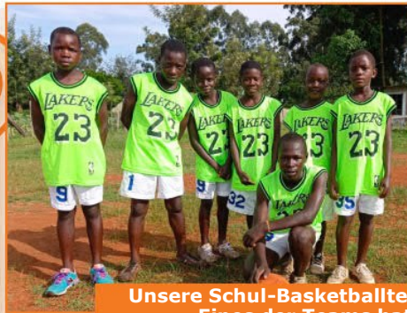
Unsere Schul-Basketballteams für Jungen und Mädchen. Eines der Teams hat sich für die regionalen Basketballwettbewerbe qualifiziert!