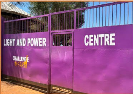
Ein frischer Anstrich für unser Eingangstor!