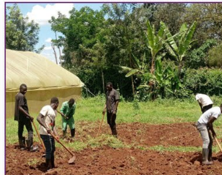
ERLERNEN VON LANDWIRTSCHAFTLICHEN FÄHIGKEITEN