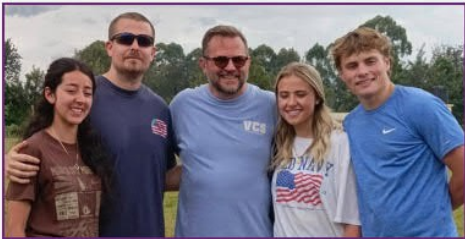
Victory Family Church Team