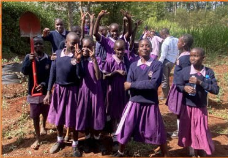
UNSER STOLZER LANDWIRTSCHAFTSCLUB!