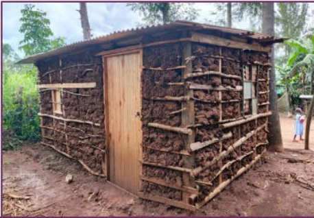
Unterstützung einer unserer Familien mit einer kleinen Unterkunft