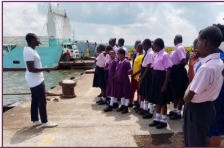
Ausflug der 8. Klasse nach Kisumu