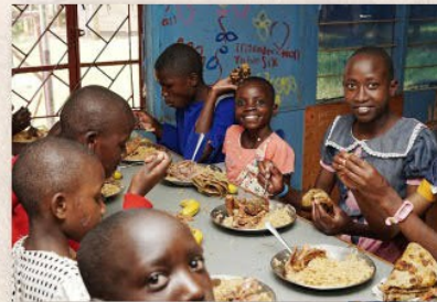
Ein leckeres Geburtstagsessen!

UNSER JÄHRLICHES GEBURTSTAGS-FEST! WIR FEIERN DAS GESCHENK DIESER WERTVOLLEN KINDER!