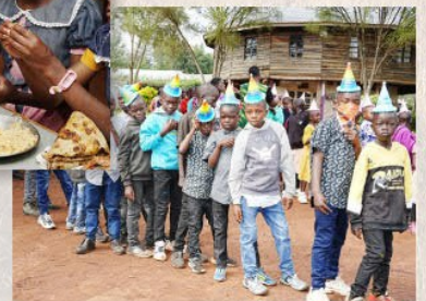
Die Jungen bei der Geburtstagsparade.