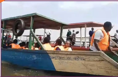
Ausflug der 9. Klasse nach Dunga Beach