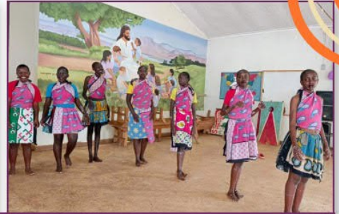
Kulturtag auf der Farm