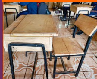
20 Schreibtische mit Ablage, 30 Stühle und 3 Küchenhocker, alle Handgefertigt von unseren Hausmeistern