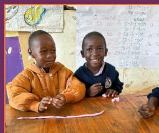
Neue Dinge lernen in der Vorschule