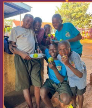
Obst an Freitagen