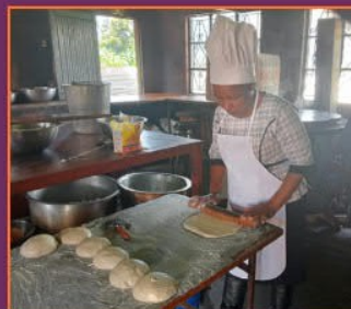
Einer unserer Köche bereitet Chapati vor