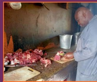
Fleisch am Freitag