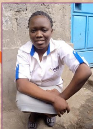
Mercy – Nähen und Schneidern

Diese Mädchen erhielten eine Nähmaschine, Stoffe und Dinge für einen Kosmetiksalon, um sie zu Beginn ihrer neuen Karrieren zu unterstützen! Glückwunsch!