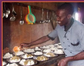
Reis und Linsen zum Mittagessen am letzten Freitag des Monats