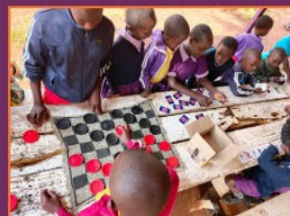
Freizeit – Spaß beim Würfeln und Kartenspielen!