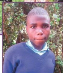
Sorophine, 14 J.