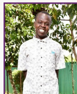
Musa heute, 2025!

Vielen Dank an alle Spender, die dazu beitragen, das Leben dieser Kinder zu verändern!