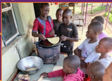
Lernen, wie man Chapati macht