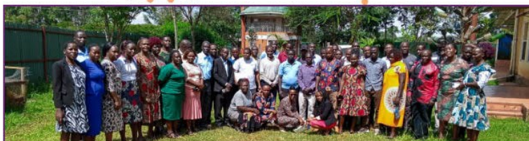
Gruppenfoto bei der Weihnachtsfeier des Personals!

DANKE AN ALLE, DIE FÜR DIE WEIHNACHTSAK- TION GESPENDET HABEN!