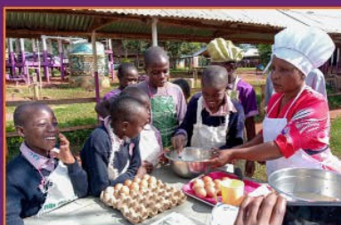
Schüler der vierten Klasse lernen Eier zu braten