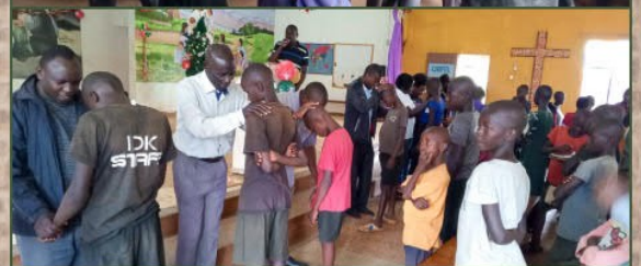
Die Mitarbeiter beteten für jedes Kind, während die anderen Kinder mitmachten.