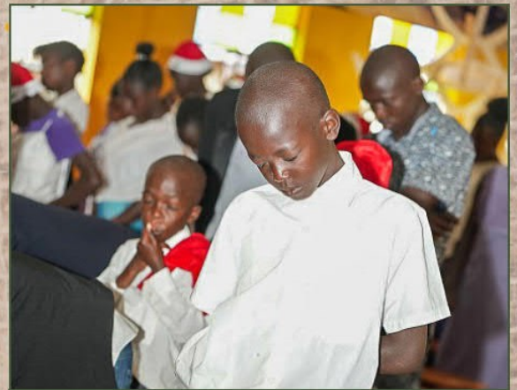
Zeit zum Beten