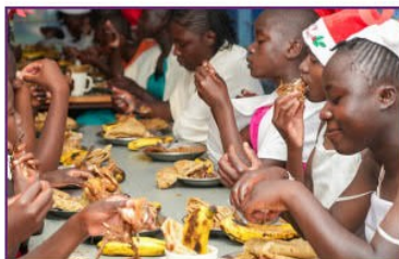
Weihnachtsfeier der Kinder!