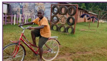
Die Weihnachtsferien genießen mit Fahrradfahren!"